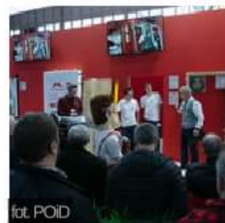
#Co słycać na MONTERIADZIE 2020