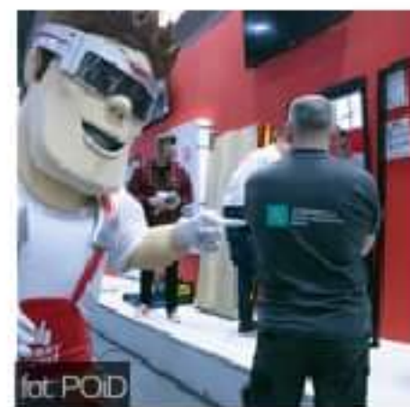
#Co słycać na MONTERIADZIE 2020

Strona główna | Oferta | Publikacje | Sieć sprzedaży - kontakt | Praca