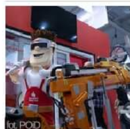
#Co słycać na MONTERIADZIE 2020