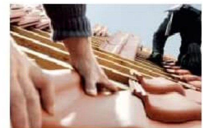
Dachówki ceramiczne i betonowe