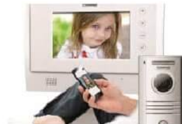
Domofony i wideodomofony