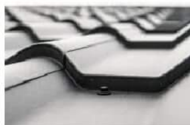
Blachy dachowe płaskie i blachodachówki