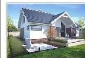
dom jednorodzinny bez garażu – projekt domu Tampa