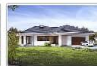
dom jednorodzinny z garażem – projekt domu Ambrozja 3