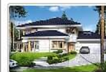
dom jednorodzinny z garażem – projekt domu Dom z widokiem