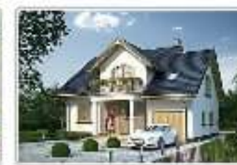
dom jednorodzinny z garażem – projekt domu APS 261