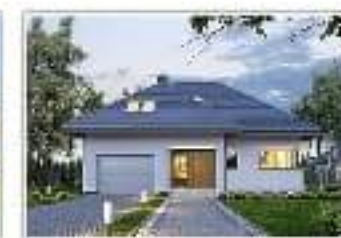
dom jednorodzinny z garażem – projekt domu E-158