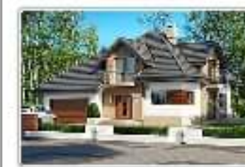
dom jednorodzinny z garażem – projekt domu Opalek II N 2G