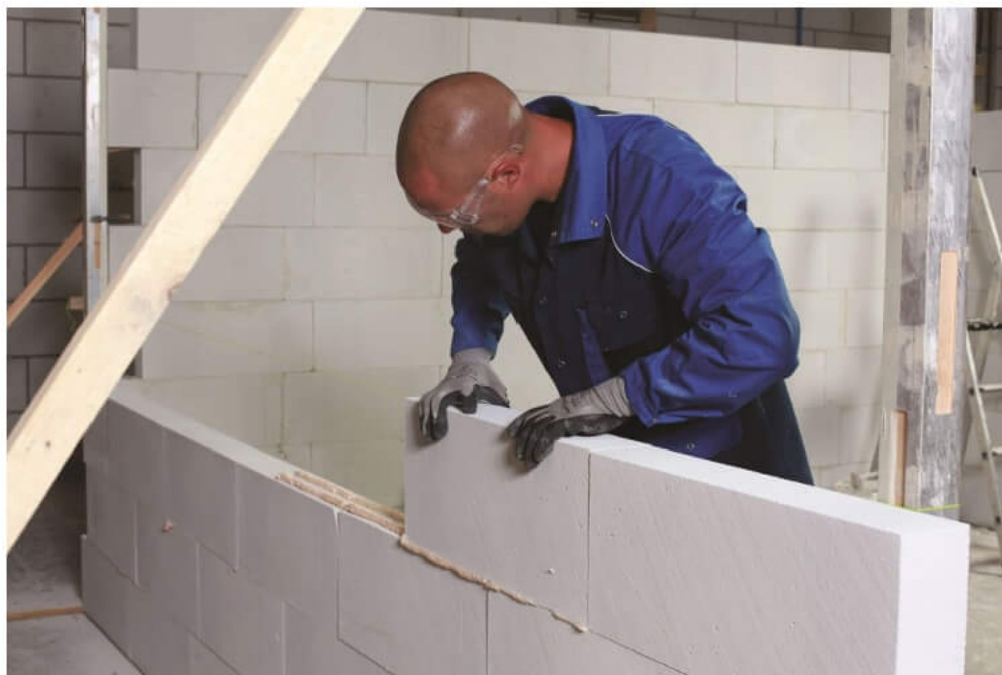
Montaż ścianki działowej na poddaszu na klej budowlany Soudabond Easy marki Soudal

W pokoju dziecięcym powinny znaleźć się trzy strefy: zabawy, odpoczynku i nauki. Jeżeli pokój zamieszkiwany jest przez rodzeństwo, to możemy pokusić się również o zorganizowanie małych stref prywatności dla każdego dziecka. W wydzieleniu stref użytkowych pomocna będzie ścianka działowa. Jej montaż przeprowadzimy szybko i sprawnie za pomocą kleju budowlanego Soudabond Easy marki Soudal.