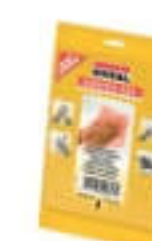
Ściereczki czyszczące Swipex