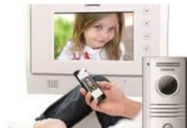
Domofony i wideodomofony