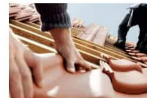
Dachówki ceramiczne i betonowe