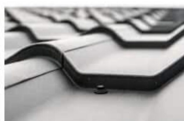
Blachy dachowe płaskie i blachodachówki