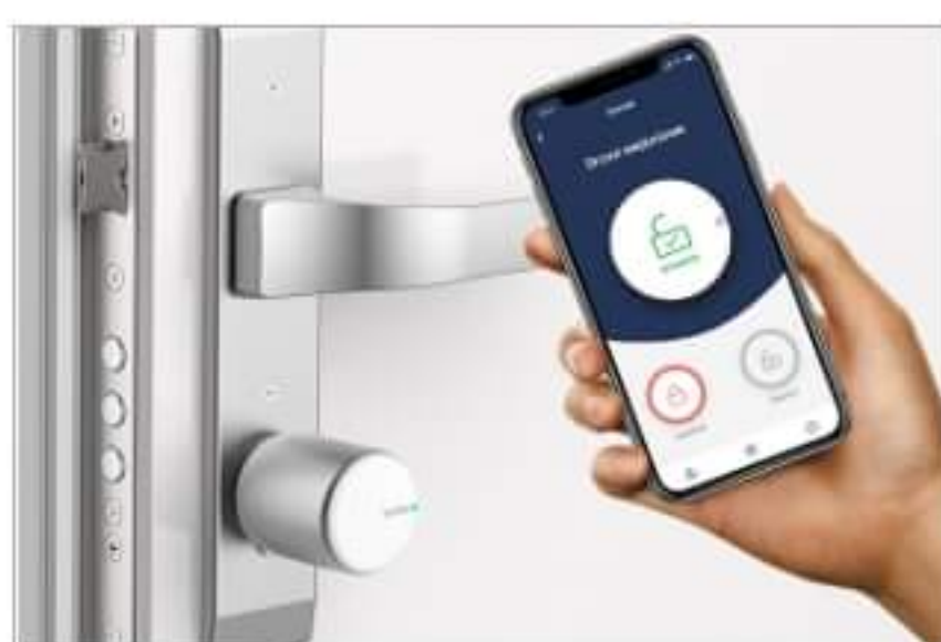
Bezpieczeństwo w Twoim smart domu - inteligentny zamek tedee...