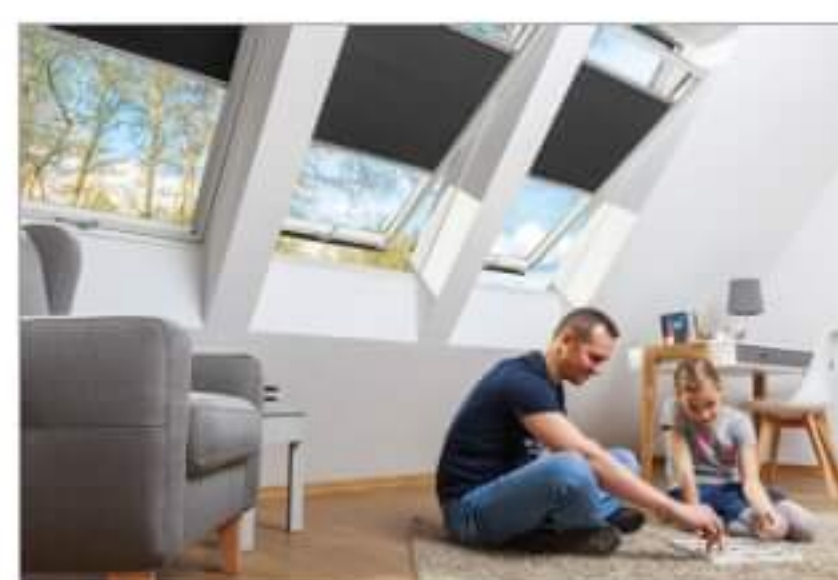
Rodzaje osłon okiennych: budowa, zalety i wady