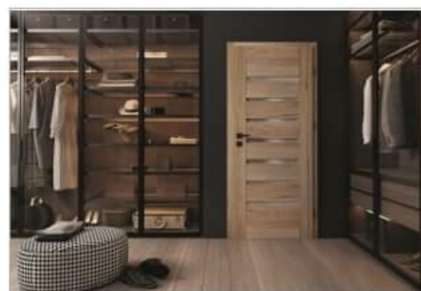
Dobór wielkości i sposobu otwierania drzwi wewnętrznych