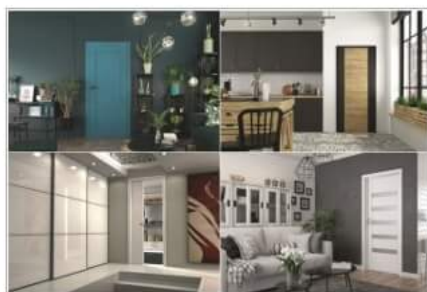
Drzwi wewnętrzne - inspiracje i ceny