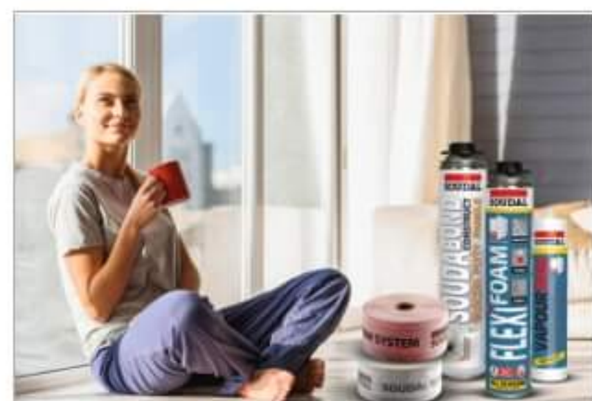
Trzy kroki do ciepłego domu