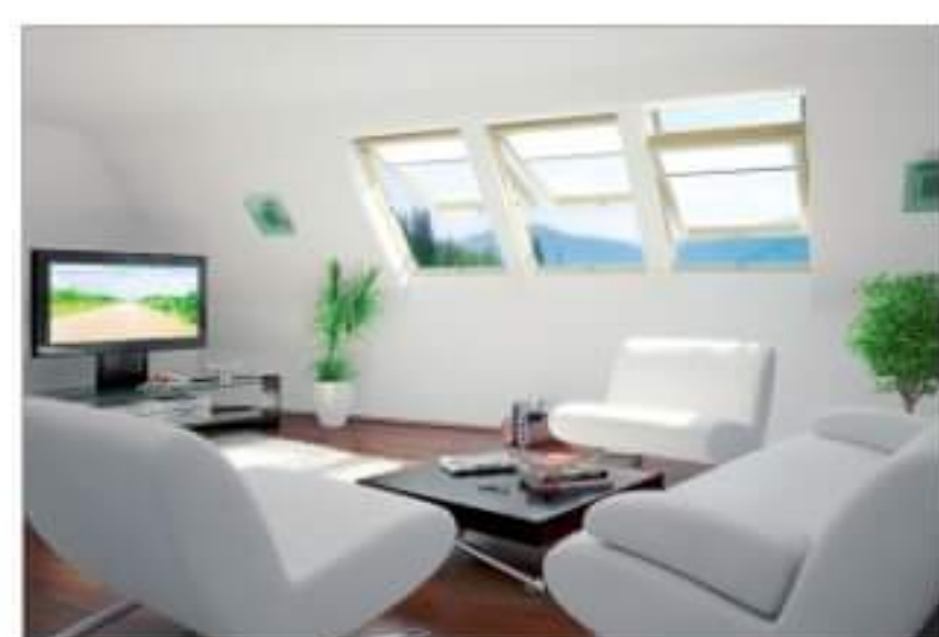
Praktyczne wskazówki przy dobieraniu dekoracji okiennych