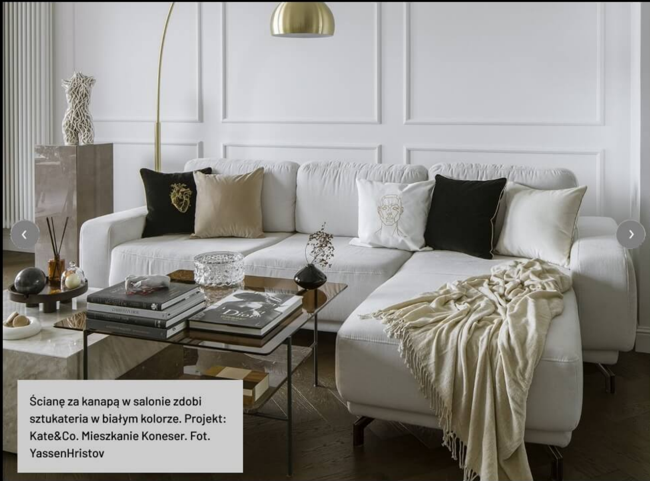
Ścianę za kanapą w salonie zdobi sztukateria w białym kolorze. Projekt: Kate&Co. Mieszkanie Koneser.