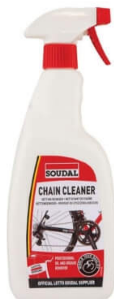
Środek do czyszczenia łańcucha

Odpowiednia konserwacja łańcucha i zębatek zdecydowanie wydłuży ich żywotność.