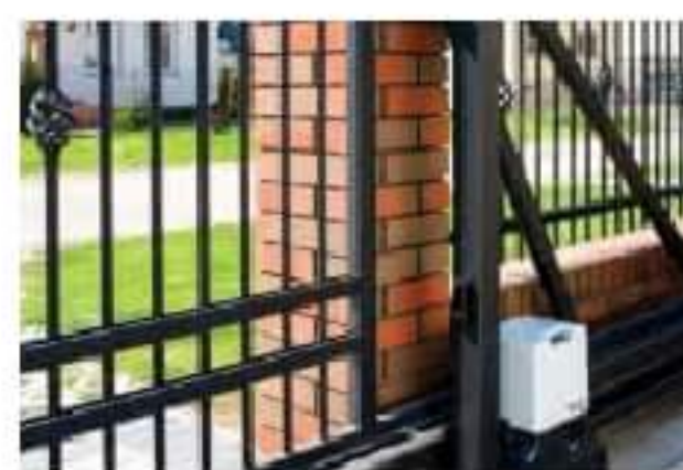
Napędy do bram ogrodzeniowych