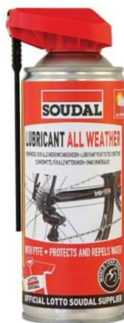
Smar PTFE

W celu zmniejszenia zużycia takich elementów, jak łańcuch, przerzutki czy linki, warto zastosować Smar PTFE na każde warunki pogodowe Soudal.