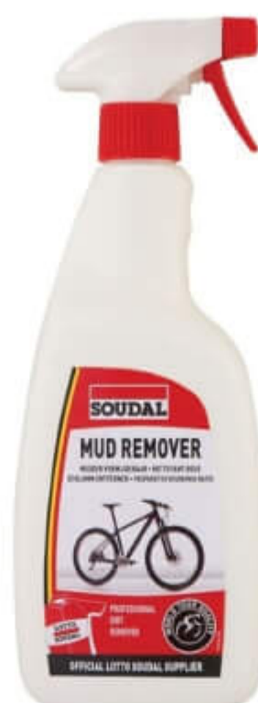
Środek do usuwania błota

Z kolei z trudnym do usunięcia brudem na ramie rowerowej, oponach, siodełku czy kierownicy znakomicie poradzi sobie Środek do usuwania błota Soudal.