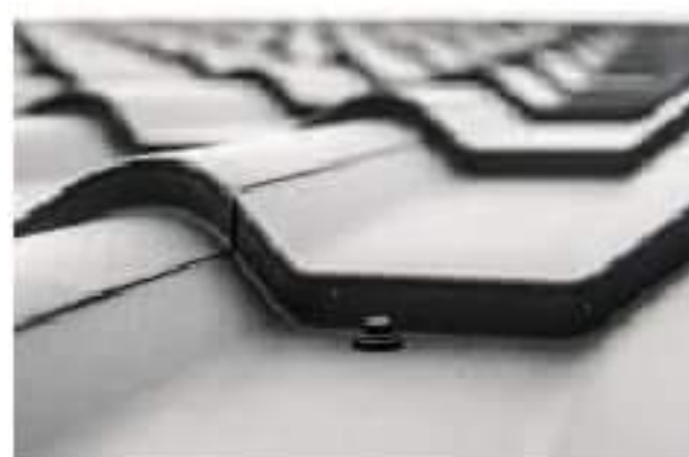
Blachy dachowe płaskie i blachodachówki