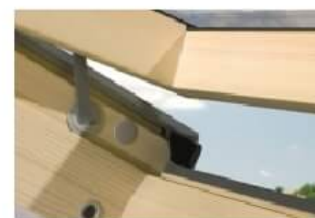
Okna dachowe (78x140 cm)