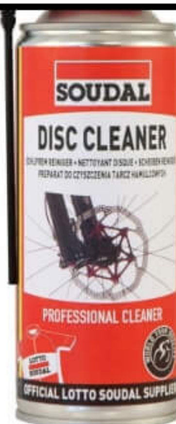
Środek do czyszczenia tarcz hamulcowych

Do usuwania zanieczyszczeń z łańcucha oraz przednich i tylnych zębatek przeznaczony jest natomiast Środek do czyszczenia łańcucha Soudal.