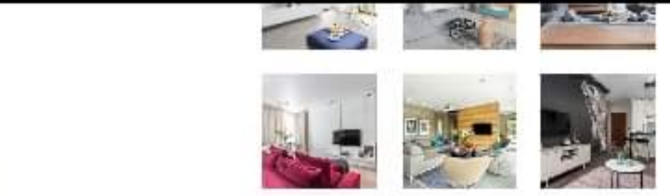
Ściana z telewizorem w salonie. Projekt gama design współ Joanna Rej