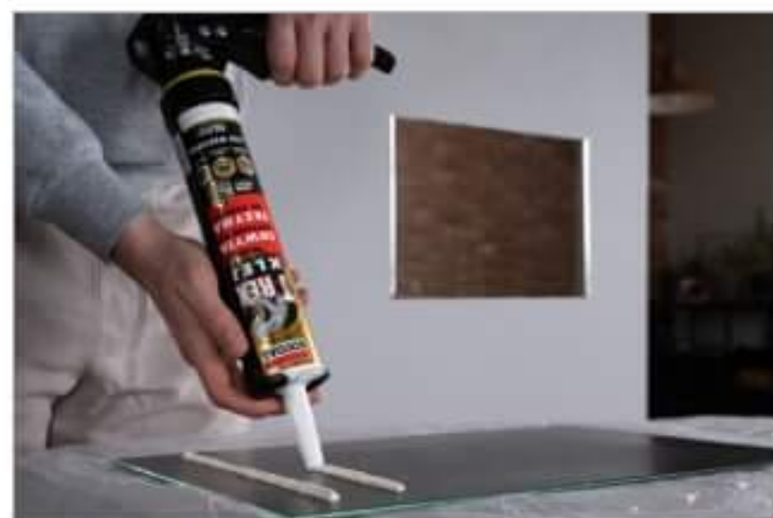
Solidny montaż z klejem T-REX Gold