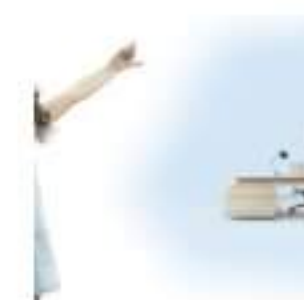
Baumit Ionit - ściany z efektem jonizacji