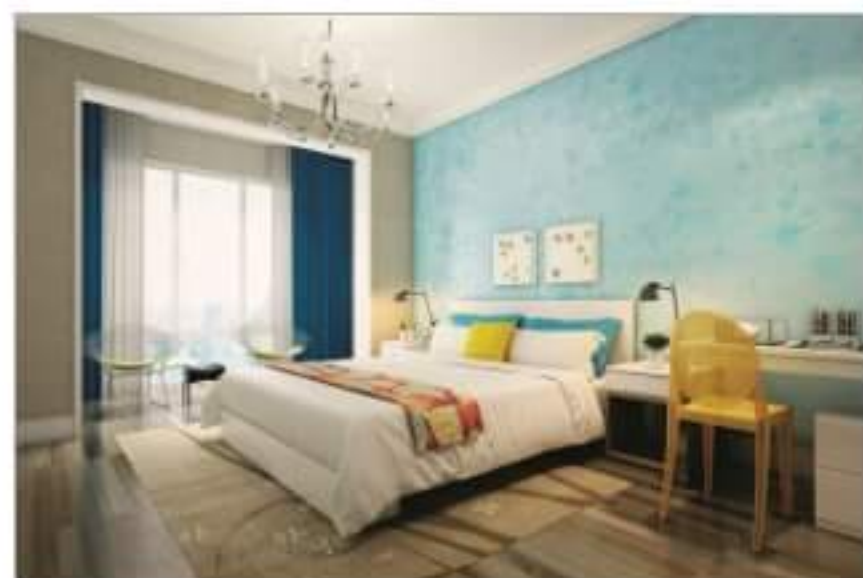
Rodzaje farb do wnętrz i ich charakterystyka