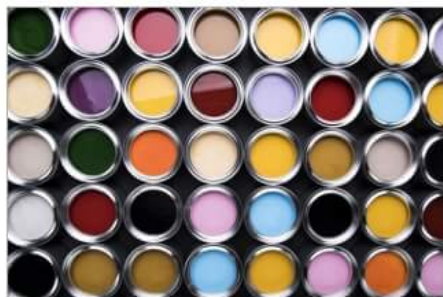
Farba poliuretanowa - rodzaje i zastosowanie