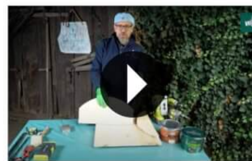
Jakim preparatem zabezpieczyć drewniany dom dla zwierząt?