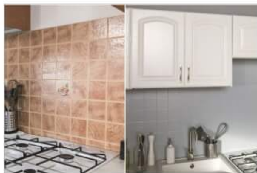
Jaką farbę wybrać do malowania płytek?