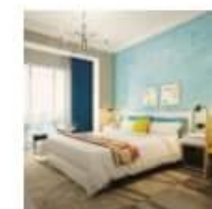
Rodzaje farb do wnętrz i ich charakterystyka