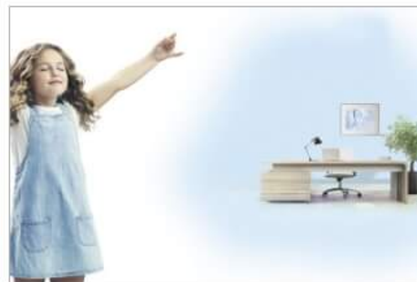
Baumit Ionit - ściany z efektem jonizacji