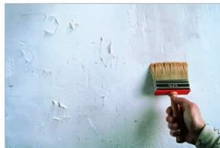
Jak stosować farbę malarską