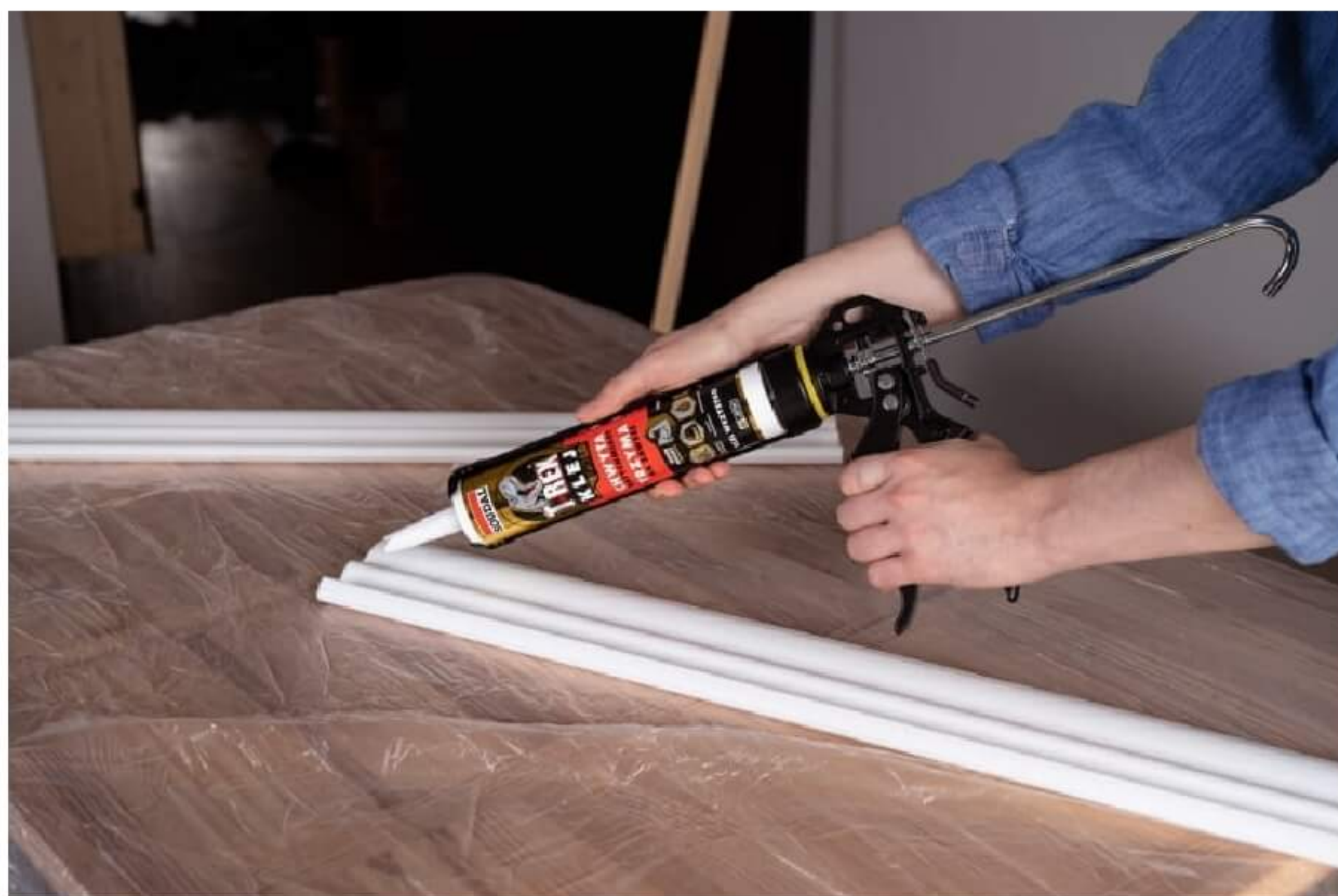
Klej montażowy T-REX Gold

Dzięki zastosowaniu nowoczesnej technologii polimerów hybrydowych SMX Klej T-REX Gold sprawdzi się doskonale w przypadku niemal wszystkich materiałów budowlanych i konstrukcyjnych, co skutecznie minimalizuje ryzyko uszkodzenia podłoża czy klejonego elementu. Ma doskonałą przyczepność zarówno do podłoży porowatych, jak i gładkich, w tym do drewna, sklejki, płyt MDF i OSB, cegły, kamienia, metali, szkła, ceramiki, a także wielu tworzyw sztucznych. Za pomocą kleju T-REX Gold solidnie przymocujemy wszelkiego rodzaju materiały wykończeniowe i dekoracyjne do ściany, podłogi lub sufitu, przykleimy osłony krawędzi schodów, listwy ościeżnicowe, płyty podłogowe czy panele ściennie. Ponieważ nie zawiera rozpuszczalników, ani silikonów jest bezwonny i całkowicie bezpieczny dla materiałów dekoracyjnych. Klej montażowy T-REX Gold cechuje się także bardzo wysoką elastycznością, dzięki czemu nie kruszy się i nie pęka.