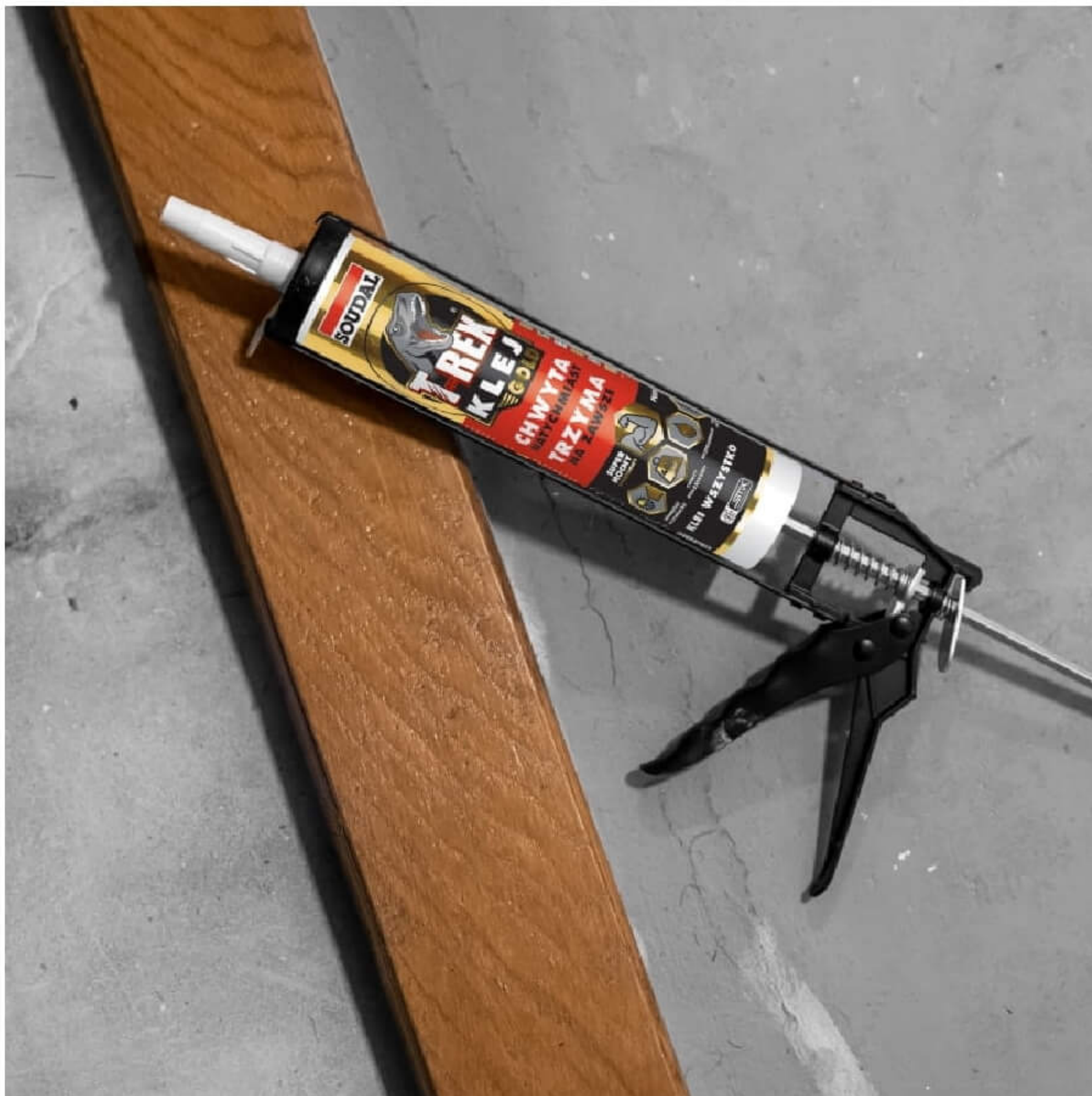
Klej montażowy T-REX Gold

Ze względu na łatwość aplikacji klej montażowy T-REX Gold jest rozwiązaniem zarówno dla profesjonalistów, jak i osób wykonujących prace wykończeniowe czy drobne naprawy w domu. Przede wszystkim użytkownik powinien zadbać o odpowiednie przygotowanie podłoża - dokładne oczyszczenie i odtłuszczenie. Klej aplikowany jest przy pomocy standardowego pistoletu, a specjalnie wyprofilowana dysza pozwala uzyskać odpowiedni kształt spoiny. Czas, w którym możemy wykonać korektę położenia klejonych elementów po aplikacji wynosi ok. 4 minuty, co pozwoli na dokładne dopasowanie. T-REX Gold doskonale sprawdzi się w przypadku klejenia różnych elementów, dlatego jest idealnym rozwiązaniem dla osób, które chcą mieć pewność skuteczności bez konieczności szukania dedykowanych rozwiązań do każdego problemu czy podłoża.