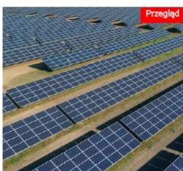
Grupa Orlen rozwija fotowoltaikę na Mazurach