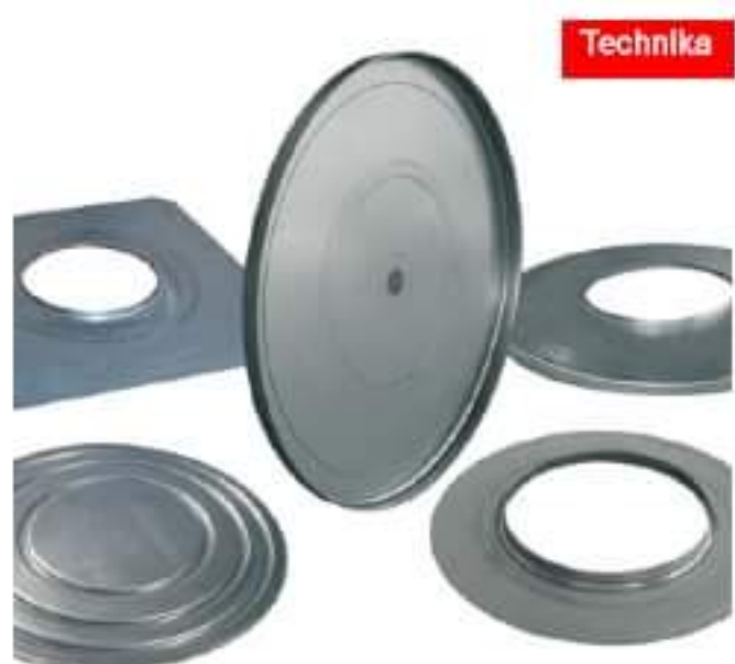
Maszyny do obróbek blacharsko-dekarSKich