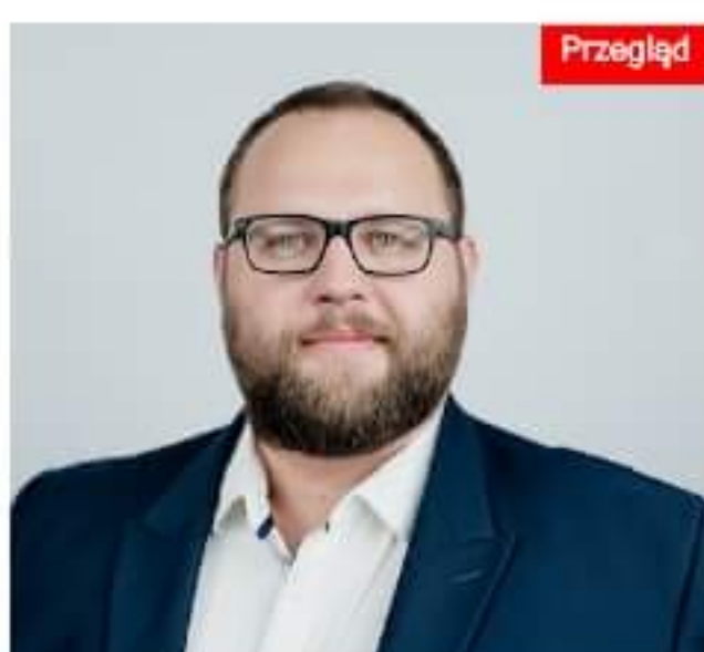
Fotowoltaika nadal będzie opłacalna