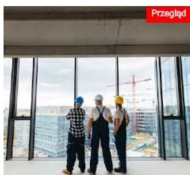
Fotowoltaika w budownictwie biurowym