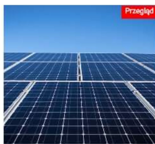
Nowe przepisy w fotowoltaice