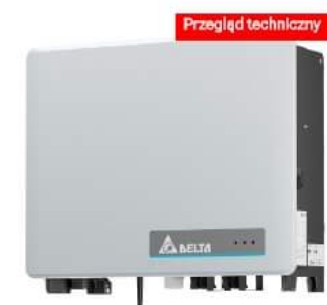
Nowe falowniki Delta M15A/M20A Flex dla budynków mieszkalnych