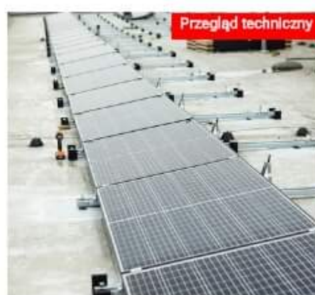
Kompletny dach energetyczny od Seleny ESG