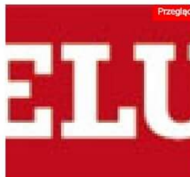
Produkty Velux w programie PolSEFF